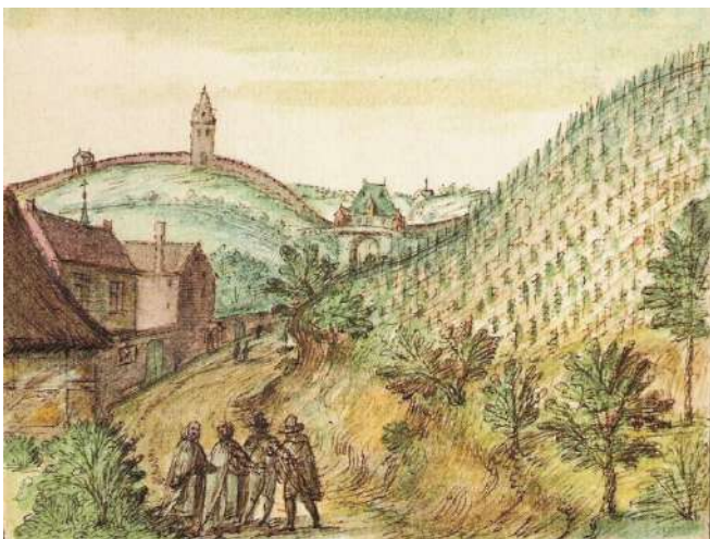
Cellebroedersklooster ter hoogte van huidige Camilo Torres in Brusselsestraat.