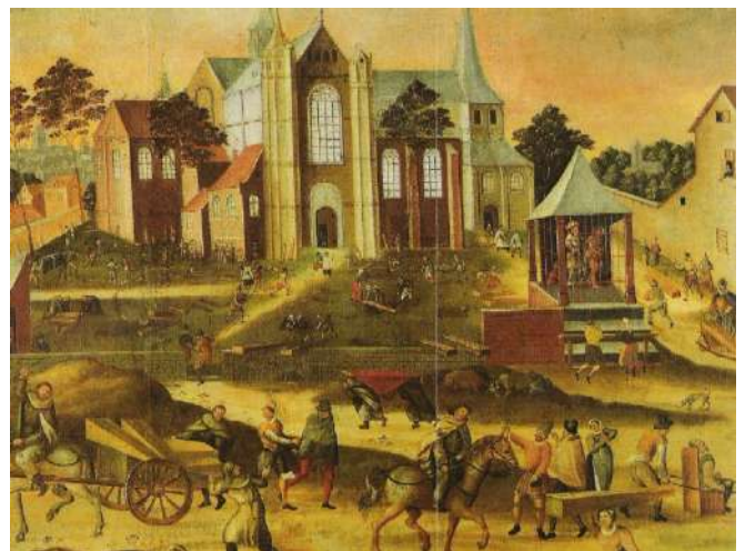
Cellebroeders begraven de doden nabij de Sint-Jacobskerk tijdens een pestepidemie in de 16 de eeuw..