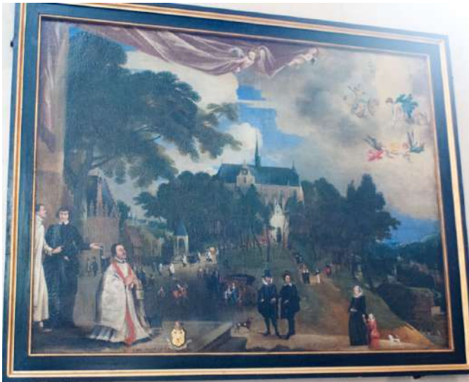
Pestprocessie naar Onze Lieve Vrouw van Neerwaver