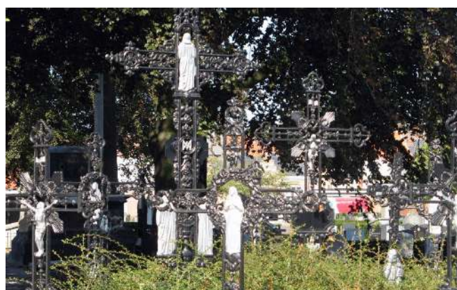
Gedenkteken Cholera epidemie 19 de eeuw, Kerkhof Leuven