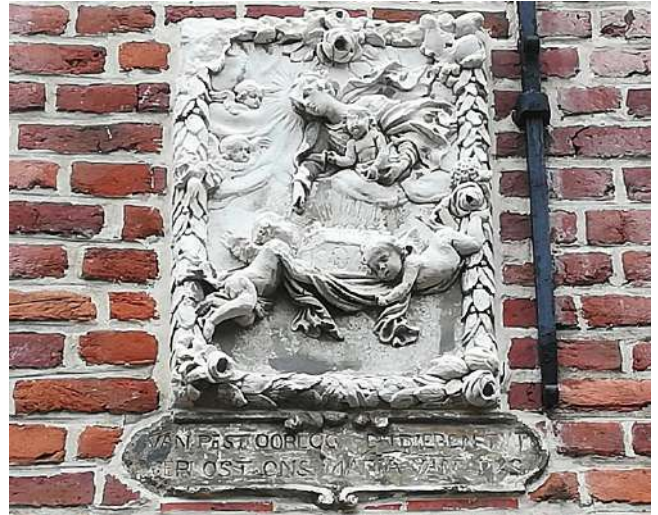
Van pest en oorlog en dieren tijd, verlos ons.