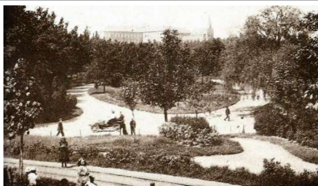
Remyvest/park, aan de Tervuurse poort, voor het doortrekken van de ring in 1958.