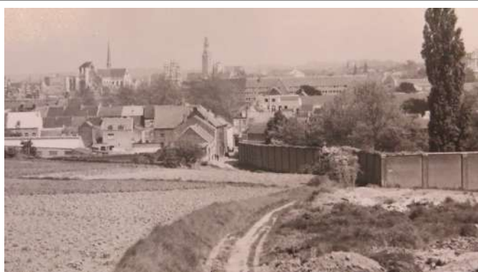
Mannenstraat, nu Van Waeyenberglaan, ter hoogte van de Groefstraat en Buurtcentrum.